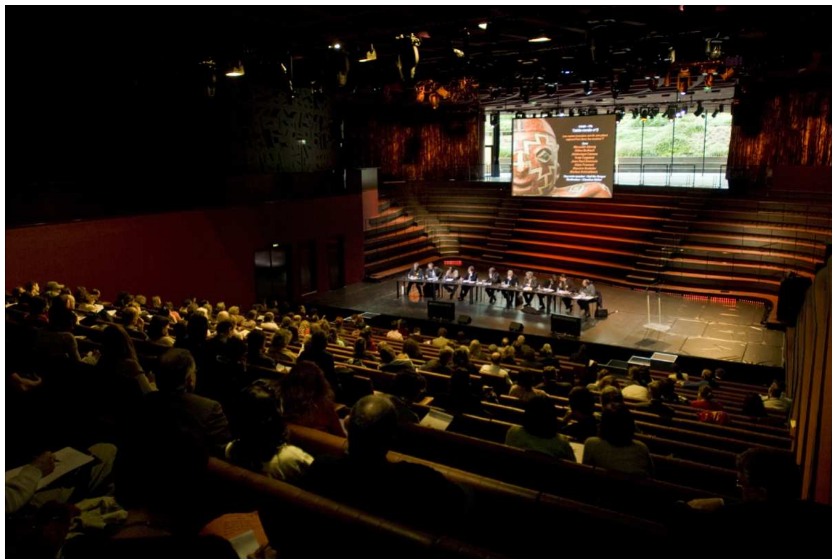
Symposium international : « Les restes humains ont-ils une place aujourd'hui dans les musées ? ». Théâtre Claude Lévi-Strauss

Le musée du quai Branly a pour vocation d'être un lieu de production et de diffusion de la connaissance scientifique. Ses champs de recherche : l'anthropologie et l'histoire des arts. Le département de la recherche et de l'enseignement initie, seul ou en collaboration, diverses manifestations qui permettent de restituer l'avancement des recherches et de diffuser la connaissance auprès d'un public plus ou moins spécialisé.