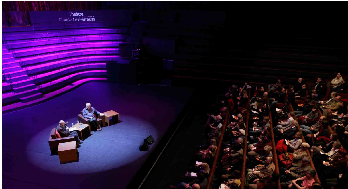
Théâtre Claude Lévi-Strauss

p3 * PROGRAMME DES RENCONTRES INTERNATIONALES