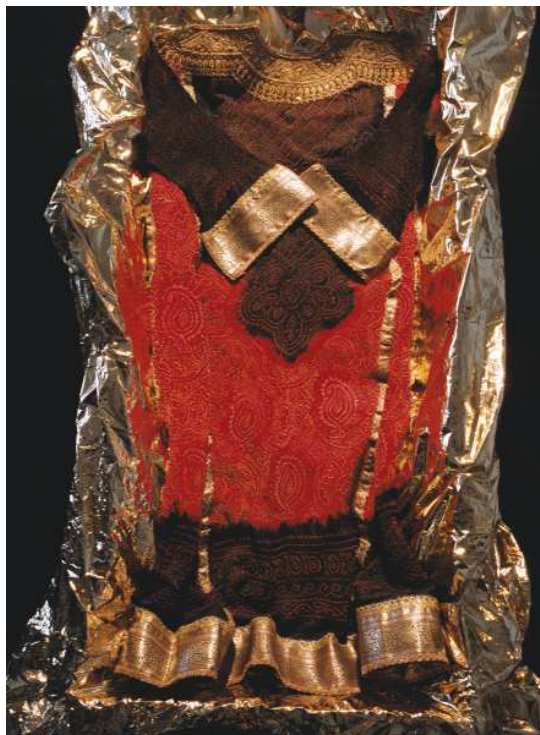
Costume de mariée musulmane.

Parmi ses publications : Recomposer une famille, des rôles et des sentiments (éditions Textuel, 1995) ; Couple, filiation et parenté aujourd'hui , rapport à la ministre de l'Emploi et de la Solidarité et au garde des Sceaux, ministre de la Justice (Odile Jacob / La Documentation française, 1998) ; La Dimension sexuée de la vie sociale (éd. de l'EHESS, 2005) ; Sommes-nous si différents ? (Odile Jacob, 2006) ; La Distinction de sexe, une nouvelle approche de l'égalité (Odile Jacob, 2007) ; Ce que le genre fait aux personnes , avec Pascale Bonnemère (éd. de l'EHESS, 2008) ; Des humains comme les autres. Bioéthique, anonymat et genre du don (éd. de l'EHESS, 2010) ; Qu'est-ce que la distinction de sexe ? (Fabert, 2011).