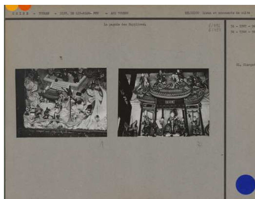
1. La pagode des Supplices 2. La pagode des Supplices