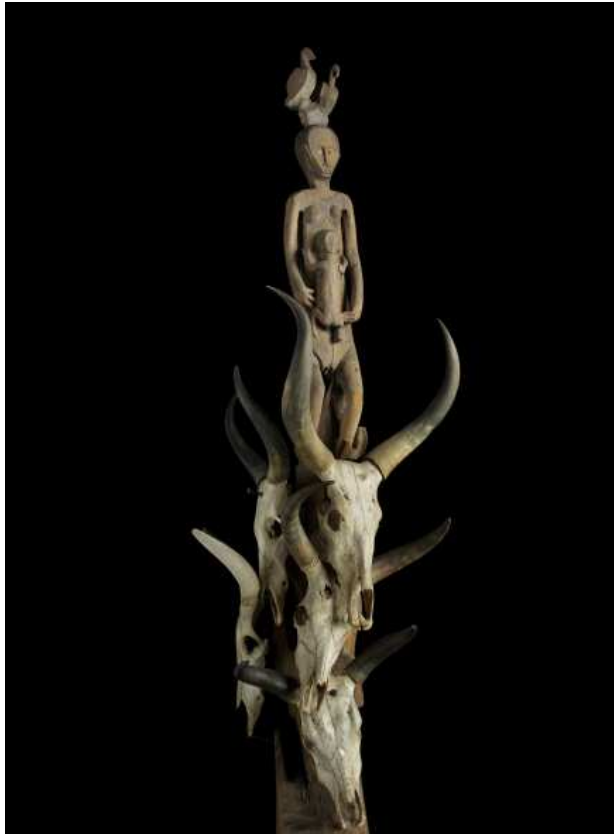
Poteau funéraire, Madagascar, 19 e siècle, population Antanosy, Bara

psychologique aux familles migrantes, au sein de l'UFR Psychologie, Pratiques cliniques et sociales de l'Université de Paris 8, centre qu'il dirige de 1993 à 1999. De 1996 à 2000, il dirige l'UFR de Psychologie, pratiques cliniques et sociales de l'Université de Paris 8. De 2000 à 2003, il dirige l'Institut d'Enseignement à Distance (IED) de l'Université de Paris 8. Puis il quitte la France : en 2003 et 2004, il a dirigé le Bureau de l'Agence Universitaire de la Francophonie pour l'Afrique des Grands Lacs, à Bujumbura (Burundi), et est Conseiller de Coopération et d'Action Culturelle à Conakry en Guinée entre 2009 et 2011.