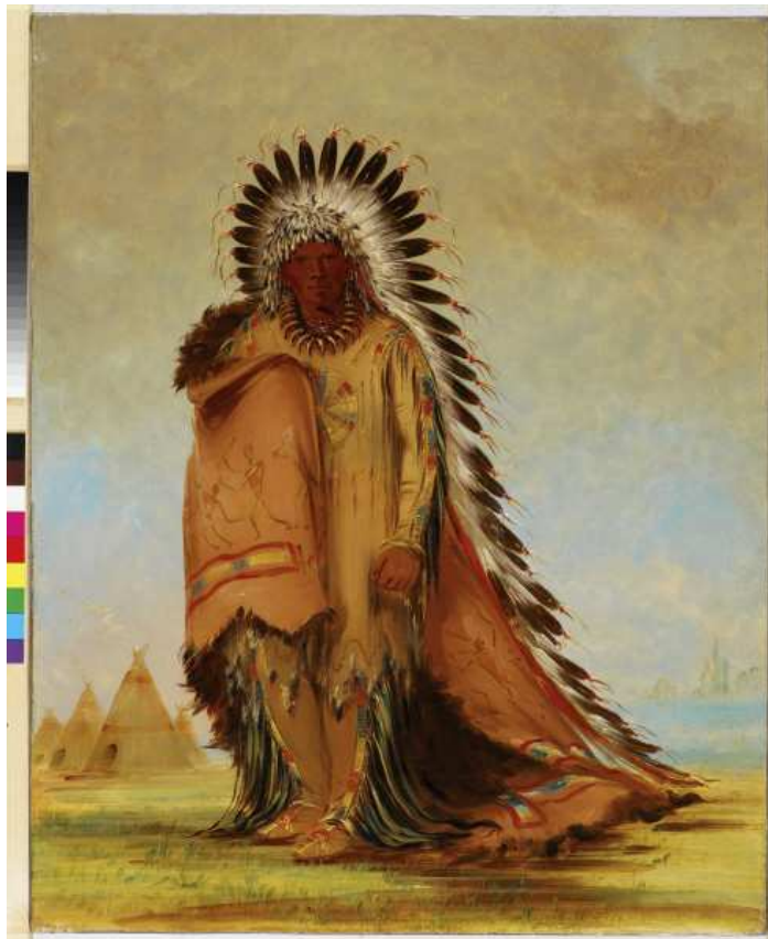
Portrait de chef indien, "Wan-ee-ton" (chef de Sioux)

Auteur de nombreux articles pour des revues scientifiques ( Gradhiva , L'Homme , Cahiers d'Anthropologie Sociale ) et des ouvrages collectifs, il a également publié La Croix et les Hiéroglyphes. Écriture et objets rituels chez les Amérindiens de Nouvelle-France, XVII e -XVIII e siècles (Éditions Rue d'Ulm / musée du quai Branly, 2009).