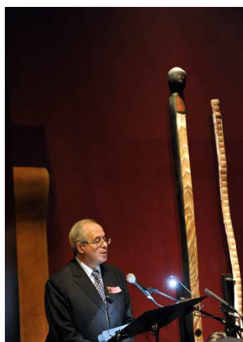
Jacques-Alain Miller