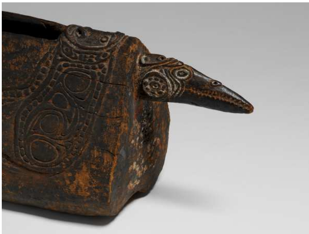
Tamboeur de bois, Océanie, début du 20 e siècle

Elle est chargée des programmes de l'Université populaire du quai Branly depuis 2003.