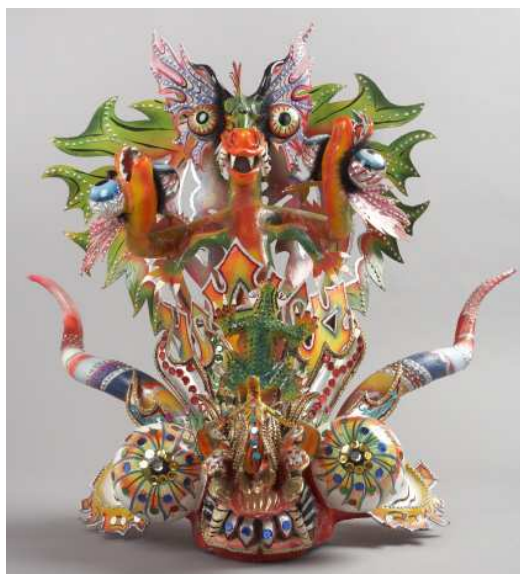
Masque de Lucifer; masque de danse de la Diablada.