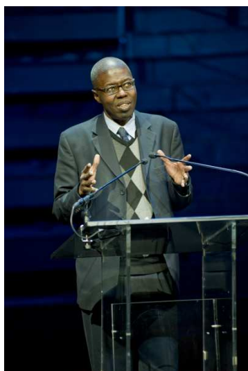
Souleymane Bachir Diagne

Léopold Sédar Senghor , par Souleymane Bachir Diagne , philosophe sénégalais, professeur à l'Université de Columbia