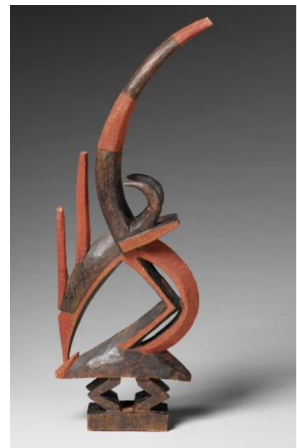
Masque cimier zoomorphe

Selon les villages, ces masques qui généralement sortent en couple, peuvent avoir un usage différent. Mais dans tous les cas, ils restent des objets fédérateurs et protecteurs pour la communauté. Ils peuvent de plus être vus de tous, n'étant pas réservés aux seuls initiés.